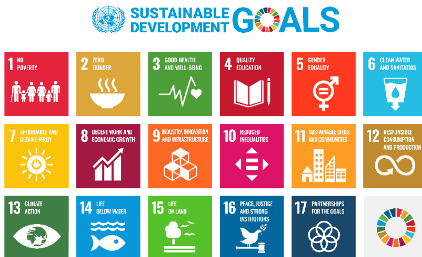
圖 2 聯合國 2030 年永續發展 17 項目標圖 註1

聯合國於 2015 年發布《Transforming our world: the 2030 Agenda for Sustainable Development》, 提出 2030 年永續發展目標(Sustainable Development Goals, SDGs), 包含 17 項目標(Goals)及 169 項細項目標(Targets), 涵蓋環境保護、經濟發展與社會進步三個永續發展面向。