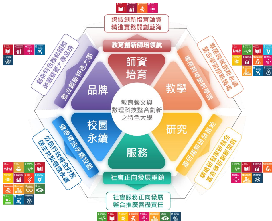
校務發展中長程計畫架構圖

本校以 校務發展中長程計畫 為基礎，擬訂年度財務規劃報告書。「115-119 年校務發展中長程計畫」以學生為核心，以「系統思維」與「結果管理」觀念與方法，盤點學校既有資源及特性，界定六大關鍵課題，規劃六大未來發展願景與六大發展總目標，將結合師培創新、教育研究、跨域合作與社會實踐，推動永續發展與國際能見度，以社會發展趨勢為導向，強化學校整體的教學、研究、服務、行政及品牌績效，進而提升學生學理實務研發與就業創業能力，期使本校成為「教育藝文與數理科技整合創新之特色大學」。計畫架構圖如下圖。