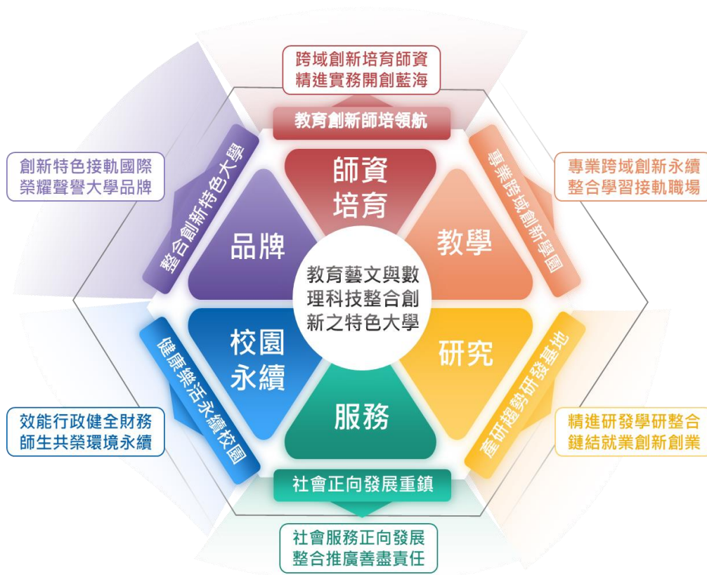
校務發展中長程計畫架構圖

本校以校務發展中長程計畫為基礎，擬訂年度財務規劃報告書。「110-114 年中長程計畫」以社會發展趨勢為導向，強化學校本質的教學、研究、服務、行政、品牌，期有效培育學生學理實務研發與就業創業能力，以「六六六創新發展計畫」為基礎，提出本校六大關鍵課題、六大願景、六大總目標以作為未來校務發展藍圖，持續追求卓越並開創永續發展新局。計畫架構圖如下圖。